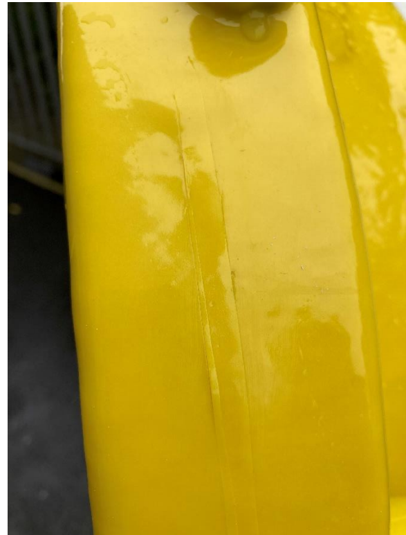
Photograph 9 Peeled Section Replaced.

K demonstraci toho, že v případě potřeby přístupu do GIS – buď přes hlavní příruby, nebo inspekční kryty – lze povlak lokálně odstranit, byl řezacím nožem proveden řez v povlaku mezi komorou a koncovým víkem a malá část byla odloupena (Fotografie 8). Je vidět, že se povlak odloupl od lakovaného povrchu a lakovaný povrch zůstal neporušený.