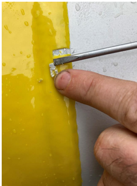
Photograph 7 Section of Coating Removed with Chamber Paint

Jak je vidět na Fotografii 7, odstraněná část povlaku se odloupla i s nátěrem komory, tj. selhala adheze mezi nátěrem a komorou, nikoliv adheze mezi povlakem a nátěrem komory.