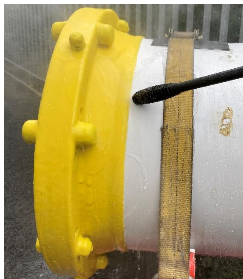
Photograph 5 Close-Up High-Pressure Spray

S vynaložením značného úsilí byla malá část povlaku proříznuta až ke stěně komory a pomocí plochého šroubováku byla část povlaku odstraněna..