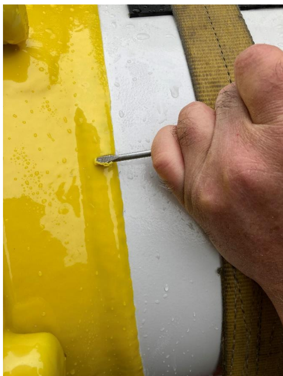
Photograph 6 Using a Screwdriver to Remove a Cut Section of Coating

S vynaložením značného úsilí byla malá část povlaku proříznuta až ke stěně komory a pomocí plochého šroubováku byla část povlaku odstraněna..