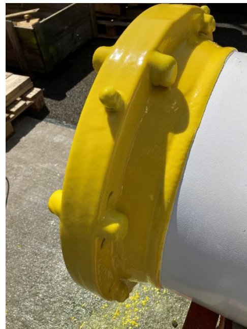
Photograph 3 Rear View