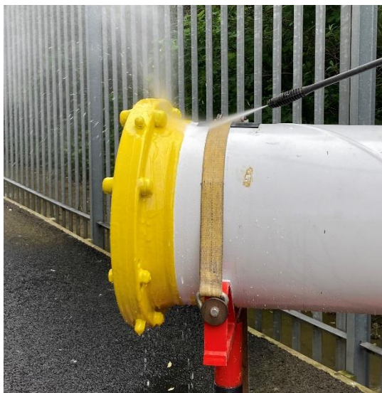
Photograph 4 High Pressure Spray

K demonstraci úrovně adheze jsme se pokusili zasunout čepel řezacího nože pod povlak v místě rozhraní, ale bez úspěchu.