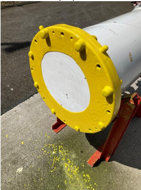
Photograph 2 End View

Konečný povlak je zobrazen na Fotografii 2 a 3, bez známek stékání materiálu na svislých plochách.