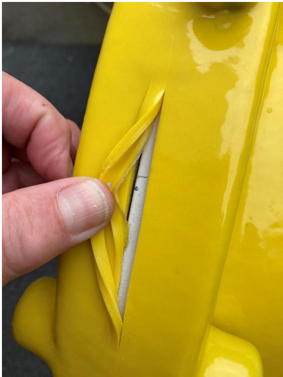
Photograph 8 Section Cut and Peeled Back at the Cover / Chamber Interface.