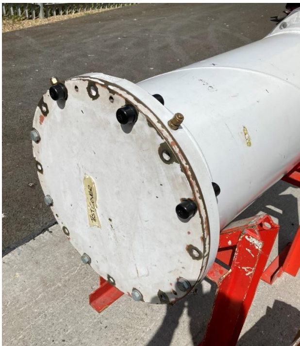
Photograph 1 YG2 Chamber Prior To Coating

Zkušebním vzorkem byla hliníková přípojnicová komora YG2 s lakovaným povrchem, osazená lakovaným ocelovým koncovým víkem z měkké oceli, upevněným pozinkovanými šrouby. Ocelové víko vykazovalo povrchovou korozi na hranách a kolem montážních otvorů. Pro účely testu byly tři upevňovací šrouby osazeny plastovými ochrannými krytkami. Příruha byla vybavena plynovým přípojným fitinkem, jak je ukázáno na Fotografii 1.